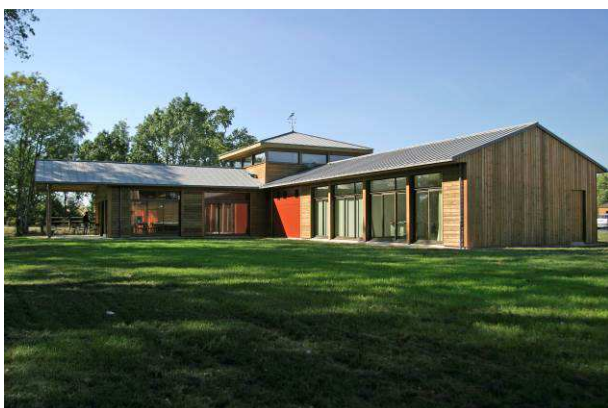
Lycée professionnel agricole Daniel Brottier à Bouaye